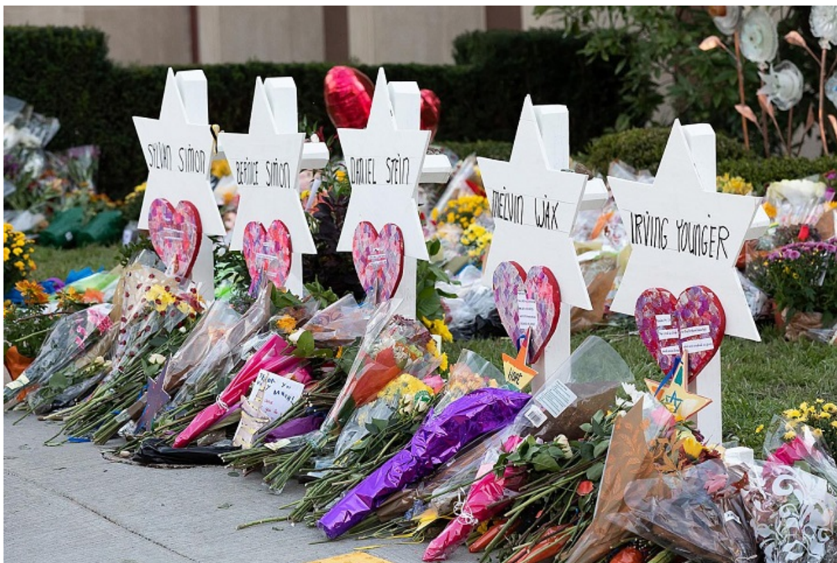
Импровизированный мемориал памяти жертв резни у синагоги «Древо жизни» в Питтсбурге

Мой материал «Сделайте нам антисемитов» анализирует абсурдный опросник Антидиффамационной Лиги, где сами вопросы приглашают давать ответы, квалифицируемые Лигой как проявления антисемитизма. Большинство американских евреев (61%) видит угрозу антисемитизма со стороны правых и лишь 22% со стороны левых. На наших улицах растет уровень антисемитского насилия, а еврейский истеблишмент борется с левыми критиками, подменяя антисемитизм антисионизмом и критикой Израиля.