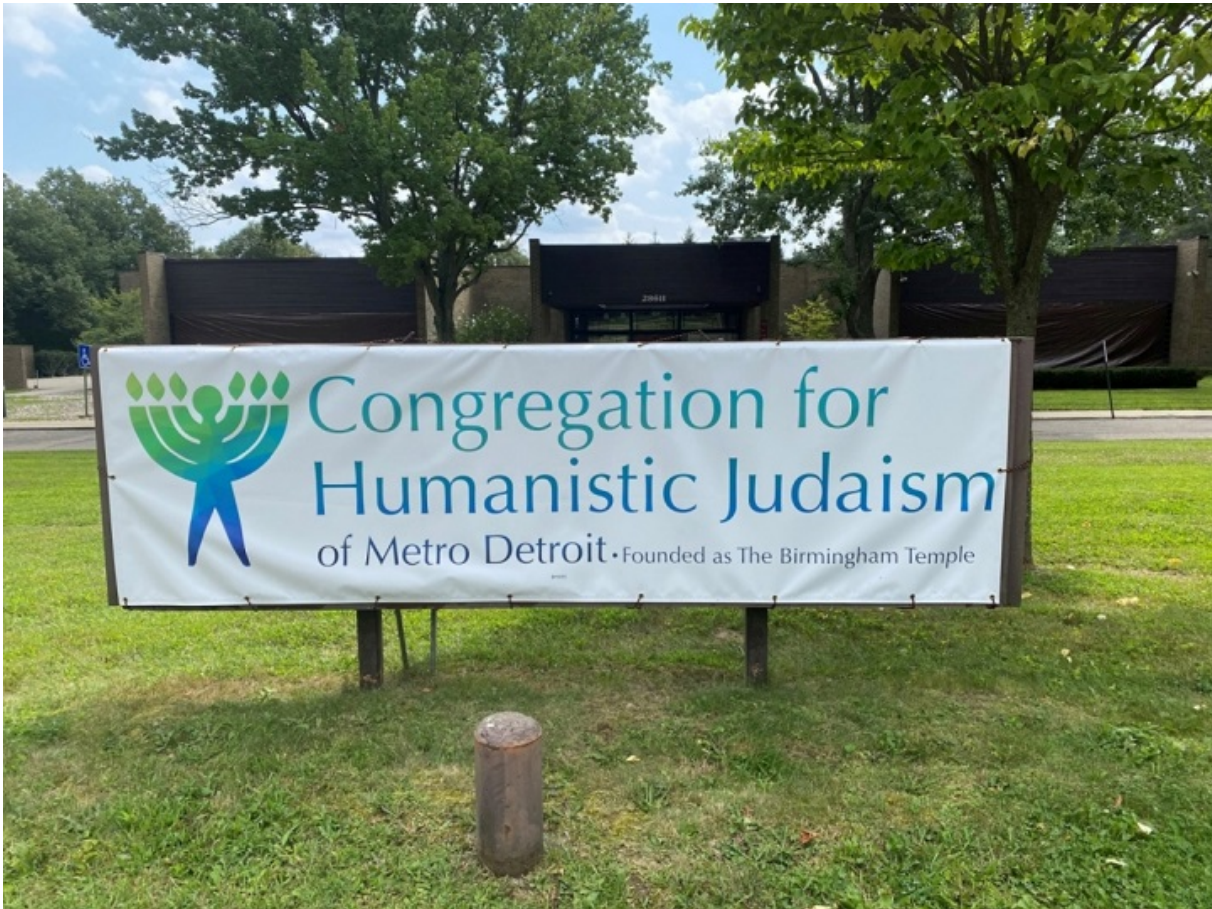
Баннер одной из общин гуманистического иудаизма

Есть даже целое течение гуманистического иудаизма, где божественная идея не имеет смысла. Представителя этого течения недавно избрали президентом капелланов Гарвардского университета.