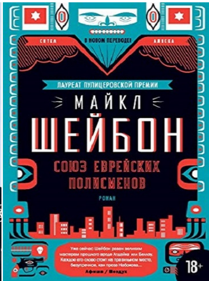
Майкл Шейбон и его «Союз еврейских полисменов»